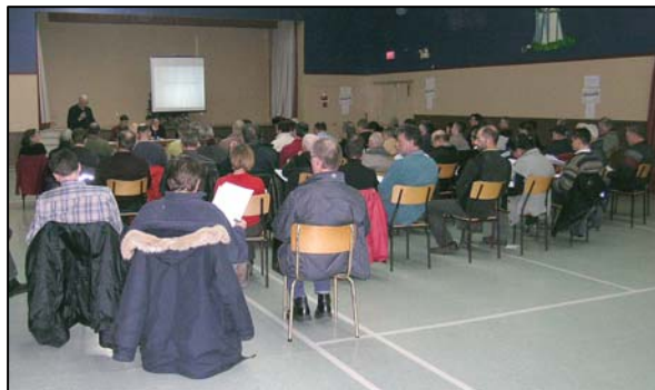
L'assemblée de fondation eut lieu le 8 décembre dernier à la salle communautaire de Kamouraska, en présence de 65 personnes intéressées par la qualité et la gestion de leurs cours d'eau.

Cet organisme de bassins versants est une table de concertation réunissant tous les acteurs de l'eau : municipaux, forestiers, agriculteurs, commerciaux, industriels, Première Nation Malécites de Viger, agroalimentaires, environnementaux, récréotouristes, éducateurs, etc. Le mandat principal d'OBAKIR est d'élaborer un plan directeur de l'eau (PDE), c'est-à-dire de faire le portrait et le diagnostic de l'état de la ressource ainsi qu'un plan d'action pour gérer les enjeux majeurs du territoire. Ce travail doit se faire avec la participation de la population. Il y aura donc dans un proche avenir des consultations publiques afin d'entériner les réflexions de la table de concertation et d'orienter les actions à venir.