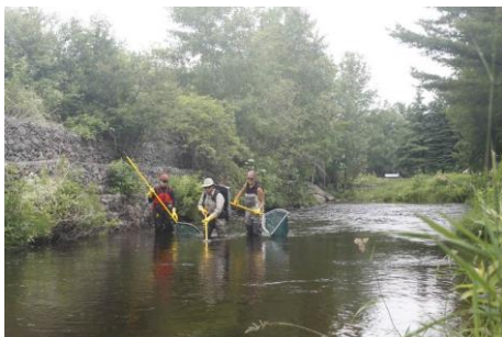
rivière Kamouraska juillet 2016

Approché par la Première Nation Malécite de Viger, OBAKIR a procédé à l'échantillonnage à la pêche électrique des rivières Kamouraska et Cacouna afin de valider la présence ou non d'anguilles. Espèce emblématique pour la communauté Malécite et pour la région de Kamouraska, une passe migratoire a été installée au barrage des sept chutes de Saint-Pascal afin de permettre le passage des civelles vers les sites de croissances.